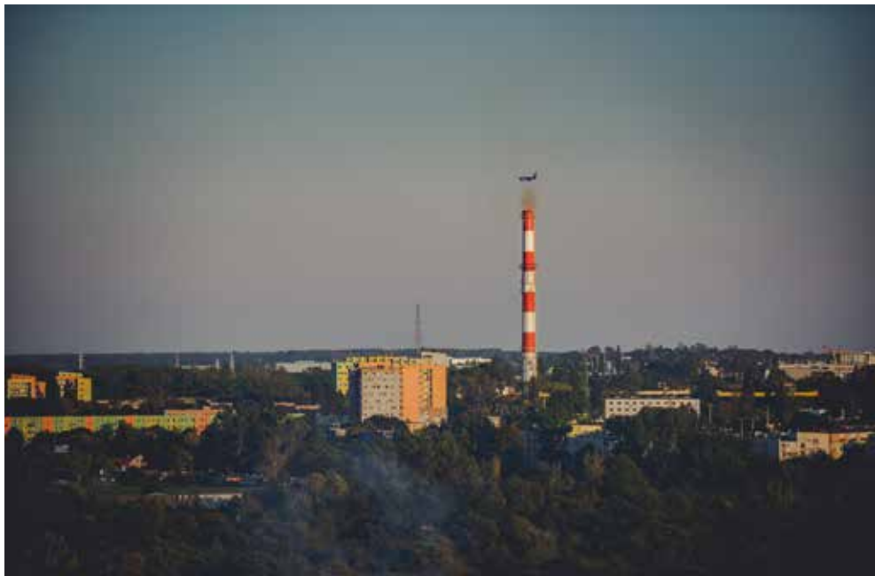
Fot. Kinga Liwak